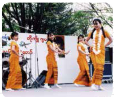
ミャンマー舞踊団

「花売り娘」など楽しいイベントを開催！ あっと驚くコスプレショーや、ミャンマーの カワイイ女の子たちの踊り、地元の劇団の パフォーマンスも！