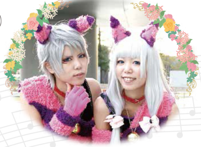
コスプレショー・多数出演

J-pop シンガーソングライター ラジオ NIKKEI! 川崎市民放送出演 藤枝音楽祭を立ち上げ、毎年開催