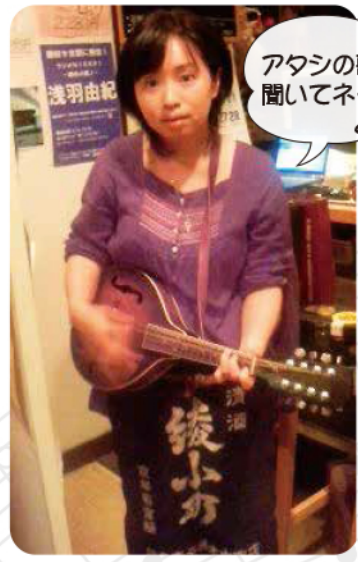
アタシの歌、聞いてネ〜

東京のモンパルナスと言って良い、花と緑のシックな町、北区の中でもこんな所があったのかと、お稲荷さんもびっくり！木立に丸く囲まれた「秘密の花園」のようなきれいな会場です。私達はここに若者のお祭り空間を作ります。フォークダンスはその場で習って踊れるものばかり。歌って踊ってエンジョイしましょう！飛び入り芸も歓迎です。ぜひ来てください。友達作り、応援します。(中央公園は二つ有ります！文化センターから入る公園です)