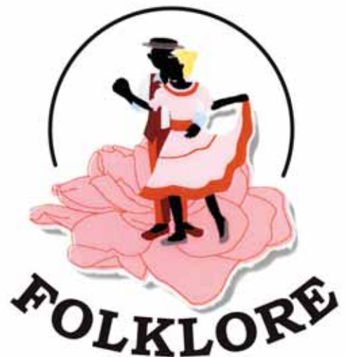
(フォルクローレ シンボルマーク)