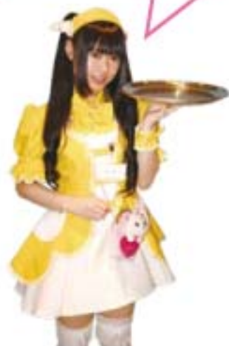
声優志望の女の子