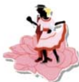
フォルクローレ シンボルマーク